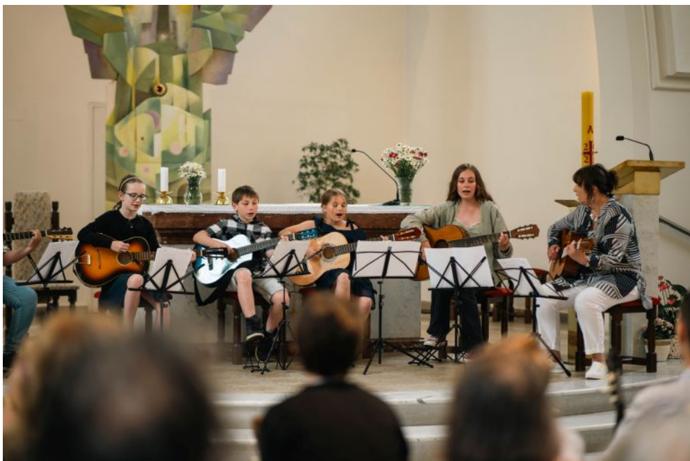
Foto z Přehlídky talentů v kostele sv. Martina a Prokopa na Lobzích